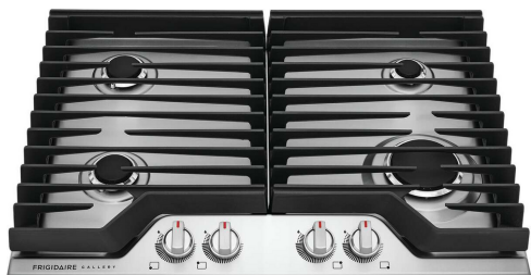
Table de cuisson au gaz de 30 po