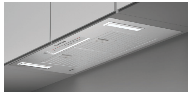
Installation dans des armoires de style européen

Accessoires : Pour acheter des accessoires, des nettoyeurs et des pièces Bosch, visitez le site www.bosch-home.com/us/store ou composez le 1-800-944-2904 (du lundi au vendredi de 5 h à 18 h HNP, le samedi de 6 h à 15 h HNP).