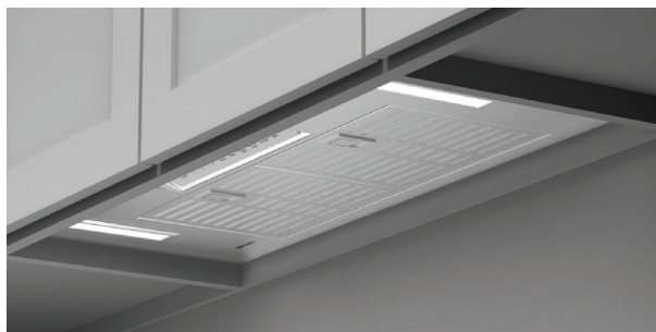
Installation dans des armoires à rebords