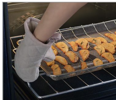
Friteuse à air chaud