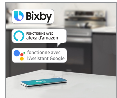
Connectivité Wi-Fi et commande vocale